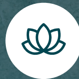
Wellness Center (Sauna, sala de Masajes.)