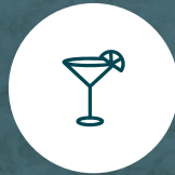
Bar en la Piscina