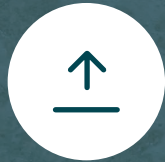
Lobby de Cuatro Alturas