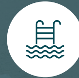
Piscina para Adultos