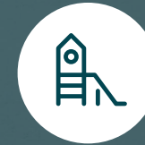
Área de Juego para Niños