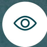
Vistas desde el Rooftop