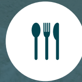
Restaurante & Lounge